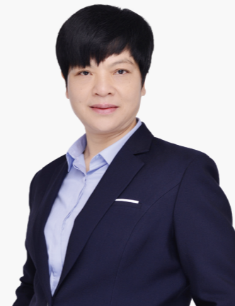
华保盛服务管理集团有限公司 南宁市第一分公司 副总经理

2012年入职华保盛服务管理集团有限公司，先后荣获集团“先进个人”“最佳管控标兵”“年度总经理特别奖”“模范人物奖”等称号，现任南宁市第一分公司副总经理，重点服务党政机关单位项目。