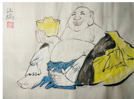
笑开天下古今愁—弥陀佛