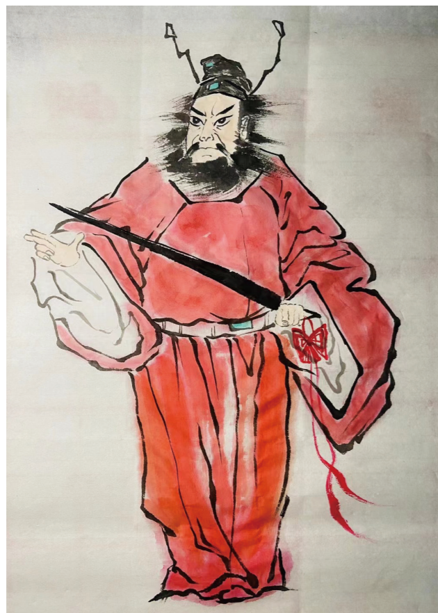
魁星点斗纳福回—钟馗