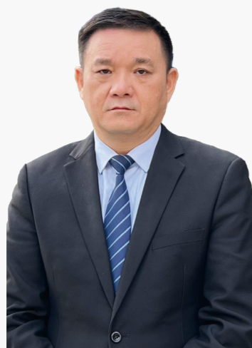
华保盛服务管理集团有限公司 南宁第六分公司 副总经理

中共党员，毕业于湖南商学院。曾在物业行业从业30年，具有丰富的大型高端物业项目管理经验。2017年6月入职华保盛服务管理集团有限公司。曾获得集团优秀项目经理、年度人物奖、华彩伯乐奖等荣誉称号。2023年1月任南宁第六分公司副总经理。